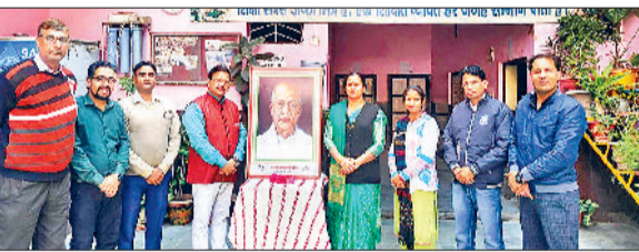
नारनौल। सरदार पटेल की पुण्यतिथि पर नमन करते हुए।

मोहल्ला चौधरीयान स्थित हरियाणा सीनियर सेकेंडरी स्कूल में शुक्रवार को देश के पहले उपप्रधानमंत्री व गृहमंत्री लोह पुरुष सरदार वल्लभ भाई पटेल की पुण्यतिथि मनाई। इस अवसर पर निबंध प्रतियोगिता का आयोजन भी किया गया। जिसका शीर्षक भारत एकीकरण में सरदार पटेल की भूमिका था। इस कार्यक्रम का मुख्य उद्देश्य लोह पुरुष सरदार वल्लभ भाई पटेल के राष्ट्र निर्माण में योगदान तथा उनकी नीतियों से