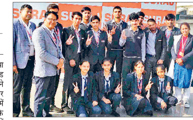
महेन्द्रगढ़। विजेता विद्यार्थियों को सम्मानित करते हुए।