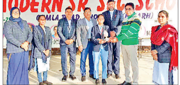
महेन्द्रगढ़। विजेता छात्रा को सम्मानित करते हुए।